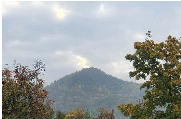
Preilipper Kuppe (mit Baumbestand)

Wir wünschen uns zudem, dass bei der sog. „Klimarettung“ nicht ganze Landstriche zerstört und Menschen ihrer Lebensgrundlage beraubt werden, ob bei uns in Thüringen, oder auch bei der Rohstoffgewinnung in Kongo, in Chile oder sonstwo auf unserer Erde.